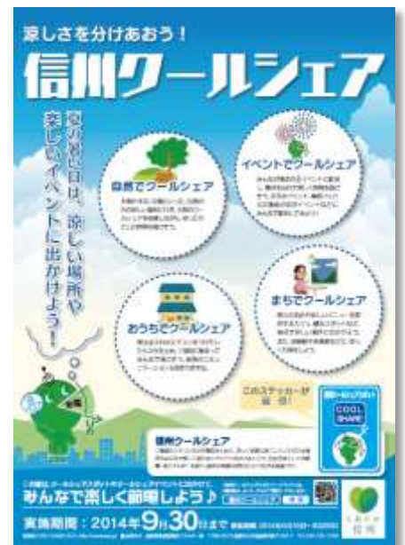
「信州クールシェア」ポスター

・自然環境に恵まれた当施設は、隣接して小川やビオトープ、森の中の自然散策路があり、ウォーキングやリフレッシュに最適です。