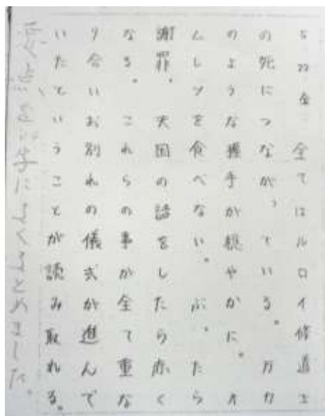
【国語】百字帳への再要約

今、作成中ですが、鼎中のHPに「学びの部屋」を作っています。英語の単語が出ていて、クリックするとその単語の発音を聞くことができます。みんなの家庭学習に役立つものを用意して応援します。