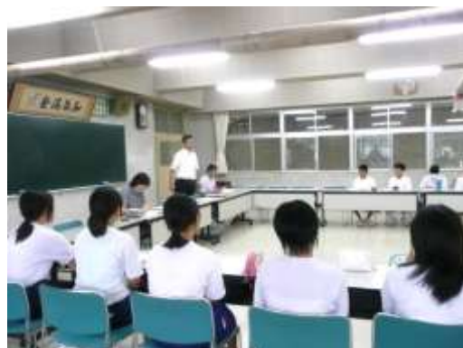
第3回プロジェクトの様子