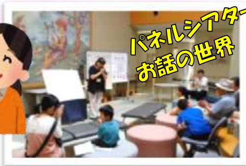
パネルシアター お話の世界