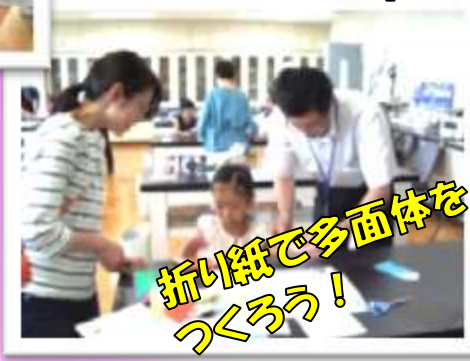
折り紙で多面体を つくろう!