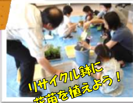
リサイクル鉢に 花苗を植えよう!