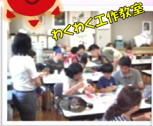
わくわく工作教室