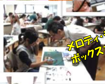
メロディ・ティッシュ ボックスをつくろう!