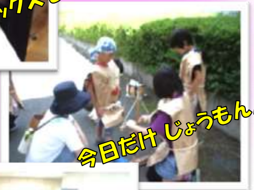
今日だけ じょうもんト