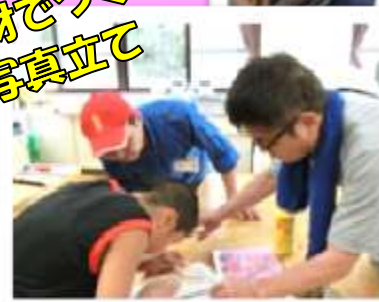
県産木材でつくる パズル写真立て