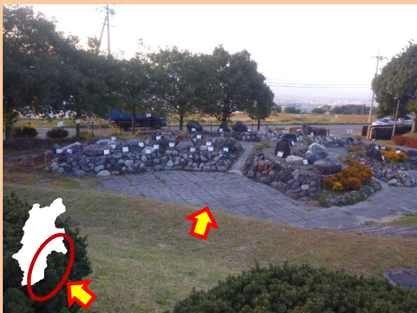
俯瞰すると、長野県の地形が現れます。 (写真は静岡県側の上空から、長野県を見ているイメージです。)