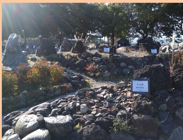
県下各地から収集された様々な岩石があります。

センター正門の南側に、岩石園があるのをご存知ですか？ 長野県の地形を模した配置で様々な岩石が展示されています。 ぜひ一度、足をお運びください。