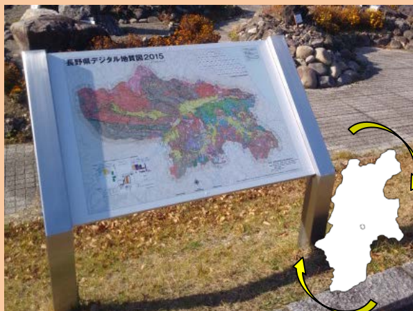
分かりやすい地質図もあります。 (長野県の地図を西を上にして掲示しています。)