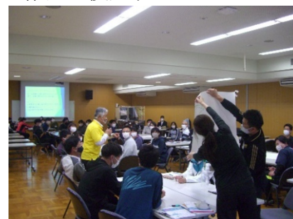
防災教育プログラムの様子